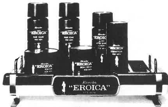
紳士用化粧品エロイカシリーズ

エロイカのあの独特の清涼感とまろやかさ、 心にゆとりを生む気品ある香り。英雄は英雄 を知るとか。エロイカは、あたくのサウナに 一級のお客さまを呼ぶでしょう。